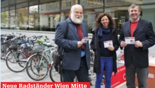
Neue Radständer Wien Mitte

12. Okt. 18 Uhr Am Mi, 12. Okt. 2016, 18 Uhr findet ein Infoabend im Agenda-Büro, Neulinggasse 36, statt. Anmeldung erforderlich unter sophiengarten@googlegroups.com . InteressentInnen für das Projekt können sich bei der Infoveranstaltung für die Teilhabe bewerben. Infos: www.facebook.com/Sophiengarten